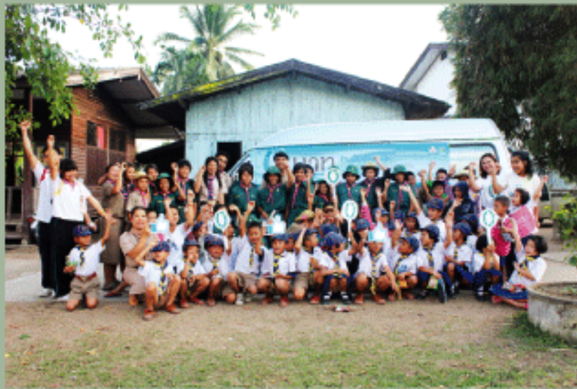
ร้าน 0 บาท โรงเรียนแม่ตื่นวิทยาคม อ.อมก๋อย

วันพุธที่ 6 มีนาคม 2556 .... TIPMSE (ทีปเอ็มเซ) จัดอบรมให้ความรู้ในเรื่องการจัดการวัสดุรีไซเคิลในสำนักงานแก่ผู้แทนหน่วยงานของสำนักงานปลัดกระทรวงมหาดไทย จำนวน 30 คน โดยได้รับเกียรติจาก นายจรินทร์ จักกะพาก รองปลัดกระทรวงมหาดไทย เป็นประธานเปิดการอบรม ทั้งนี้ทางสำนักปลัดฯ มีแผนจะเริ่มดำเนินกิจกรรมการคัดแยกวัสดุรีไซเคิลในสำนักงานช่วงต้นเดือนเมษายน เพื่อเป็นการปลูกฝังให้พนักงานรู้จักการคัดแยกวัสดุรีไซเคิลอย่างถูกวิธี