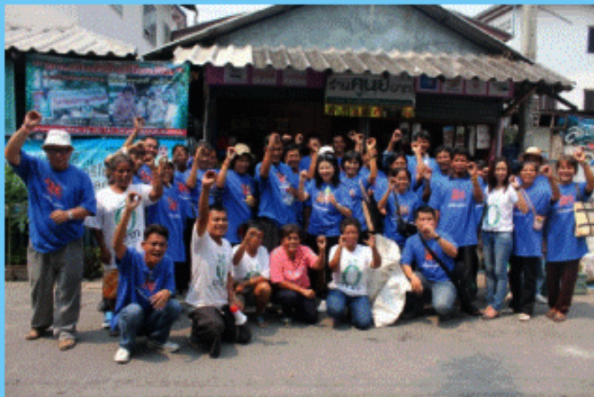
บริษัท ไทยเอเชีย แปซิฟิคฯ เยี่ยมชม ร้าน 0 บาท

วันที่ 6 กุมภาพันธ์ 2556... TIPMSE ได้จัดอบรมและศึกษาดูงานร้าน 0 บาท แก่มหาวิทยาลัยจำนวน 3 แห่ง ประกอบด้วย มหาวิทยาลัยเทคโนโลยีสุรนารี มหาวิทยาลัยราชภัฏอุดรธานี และมหาวิทยาลัยราชภัฏจันทรเกษม ซึ่งเป็นโครงการต่อเนื่องจากการอบรม TIPMSE GREEN CAMP & TIPMSE AMBASSADOR 2012 เพื่อให้เกิดความเข้าใจถึงรูปแบบในการดำเนินการของร้าน 0 บาท อย่างเป็นรูปธรรม